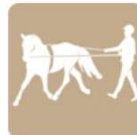
TRAVAIL À PIED