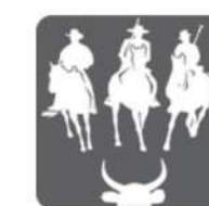
Equitation de travail